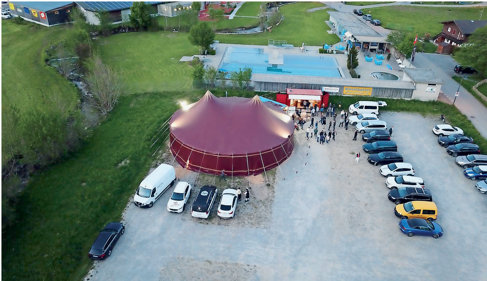
Der Standort neben der Badi in Unterwasser war ideal. Da die nahegelegene Talstation der Iltiosbahn neugebaut wird, schlug Martin Sailer die Zelte 2024 beim Steinbruch in Starkenbach auf.

Wegen des Neubaus der Talstation Iltios musste sich Sailer mit seinem Zeltainer heuer einen neuen Standort suchen. Gefunden hat er ihn in Starkenbach beim Steinbruch. Dort kann das Theater aber nur 2024 bleiben. Sailer sucht nun händeringend nach einer Bleibe für die nächsten Jahre. Für die Zukunft ist ein fester Standort in Wildhaus im Munzenriet neben der Curlinghalle geplant. Das Projekt ist schon fast ausgereift: Ein 600 Quadratmeter grosses Theater mit ausfahrbarer Teleskopbühne, sodass im Raum bis zu 800 Stehplätze zur Verfügung stehen, soll es werden. Für die Realisierung benötigt Sailer 3 bis 3,5 Millionen Franken. Über 100 Stiftungen hat er bisher angeschrieben. Mit wenig Erfolg. «Ich hätte es mir einfacher vorgestellt», sagt er leicht resigniert und hofft, dass sich doch noch ein Mäzen oder eine Mäzenin für das Neubauprojekt begeistern kann, so wie er selbst Feuer und Flamme dafür ist.