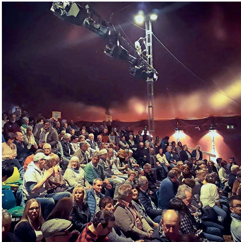
Comedy kommt beim Publikum gut an.

Gerne bewegt er sich auch draussen in der Natur mit seinem Hund. «Ich habe den liebsten Hund der Welt!», sagt er über seinen Border-Collie-Mischling Buddy. Und mit Hunden – und Katzen – verdient er einen Teil seines Lebensunterhalts: «Warik, mein