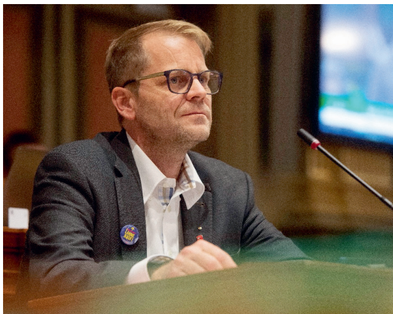
«Kulturminister» Martin Sailer politisiert im St.Galler Kantonsrat.