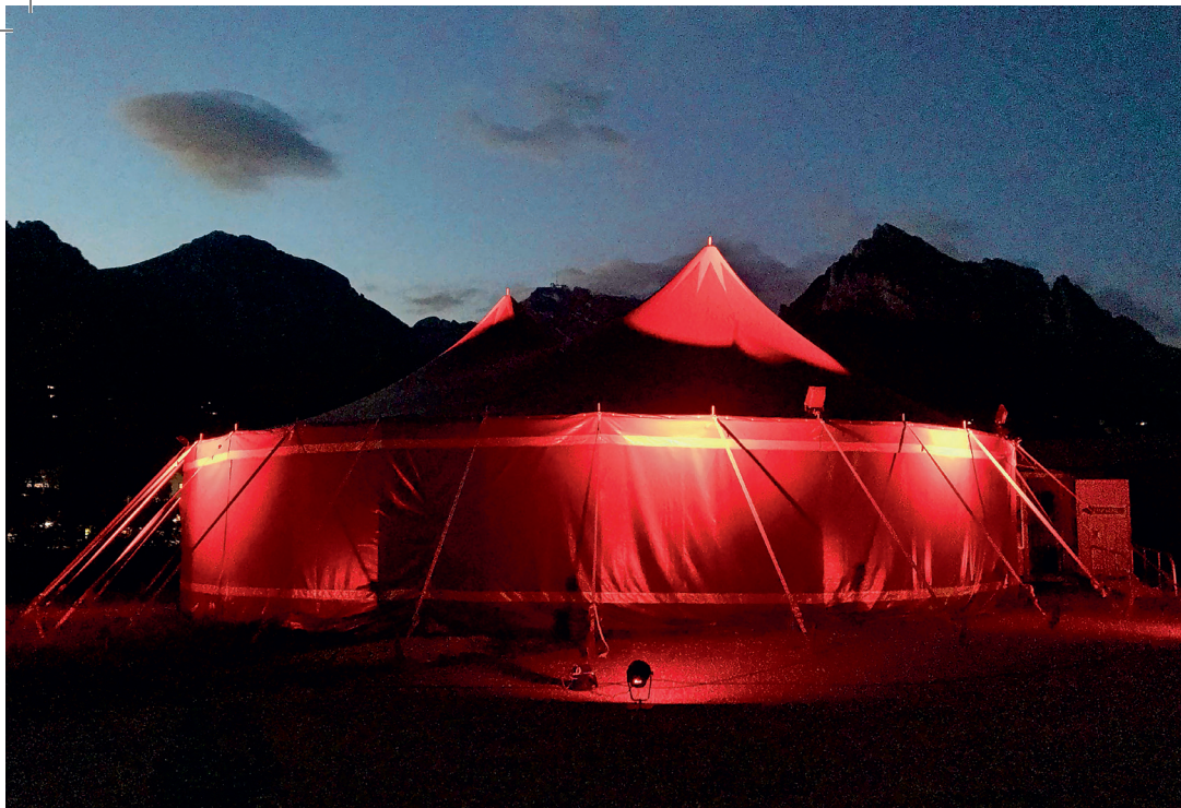
Nächtliche Zirkusromantik vor dem Säntis und dem Wildhauser Schafberg.